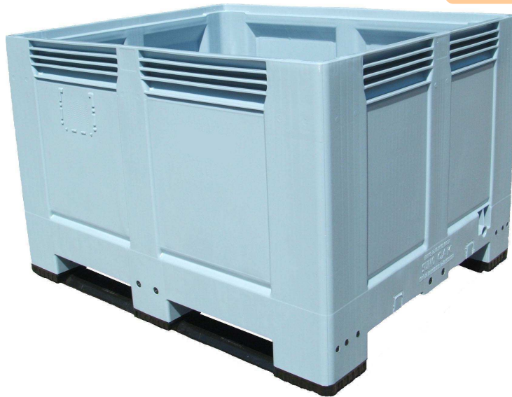
Palox 1200 x 1000 x 787 mm., fond et parois pleins, 2 semelles